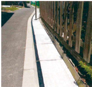
狭い住宅街でのすれ違いが容易になります