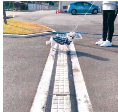
通学路における児童の安全の確保に最適